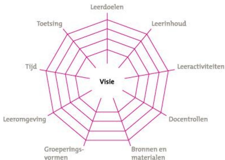
Figuur 1 het curriculaire spinnenweb.

De doelen zoals die omschreven zijn in het leerplanvoorstel vormen de basis voor onderwijsactiviteiten. Het mag duidelijk zijn dat de doelen nastrevenswaardige idealen omvatten die niet te vatten zijn in een aantal lessen, maar die gebaat zijn bij een brede, langdurige aanpak waarbij meerdere facetten van het onderwijs aangesproken kunnen worden. Dit is in lijn met de holistische benadering die kenmerkend is voor mensenrechteneducatie. Het curriculaire spinnenweb van SLO (Akker & Thijs, 2009) biedt een goed model om onderwerpen die de hele schoolorganisatie raken op samenhangende wijze te ordenen. In dit model staat de visie centraal. Het realiseren van die visie is waar het model om draait. Daarbij vormen de draden van het spinnenweb de variabelen die benut kunnen worden om de visie in praktijk te brengen. Bijvoorbeeld het stellen van doelen, het kiezen van leermiddelen, het bepalen van leeractiviteiten, het benutten van de docent als voorbeeld, het samenstellen van groepen leerlingen en dergelijke. Het model is zowel te gebruiken op landelijk niveau als op school en klasniveau. Het onderstaande voorbeeld richt zich op het schoolniveau.